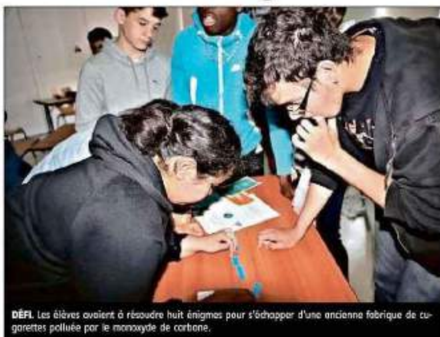
DÉFI. Les élèves avaient à résoudre huit énigmes pour s'échapper d'une ancienne fabrique de cigarettes polluée par le monoxyde de carbone.

Au cours de ce rendez-vous, proposé sous forme d'un escape game, les jeunes ont eu à collaborer ensemble pour s'échapper